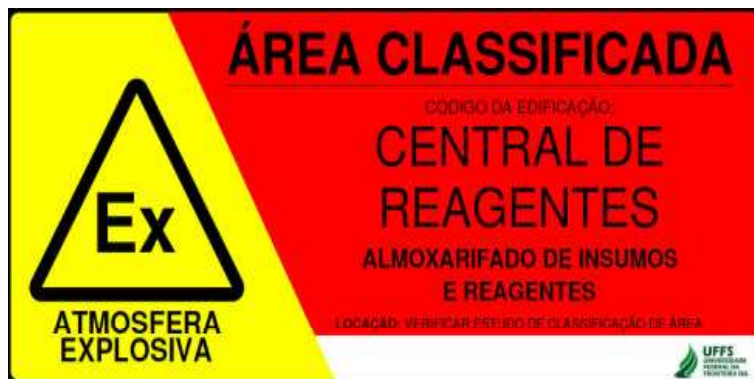
Figura 1 - Leiaute de Placa Tipo I