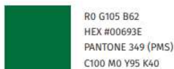
Figura 4 – Códigos do verde padrão UFFS

Ainda, deverá ser executado 1 letreiro trazendo a logomarca institucional da UFFS composto por Letra Caixa PVC Expandido 20 mm com pintura na cor verde padrão UFFS, fontes Eras Bold na descrição UFFS e Fire Sans Condensed no texto “CENTRAL DE REAGENTES”, conforme imagens a seguir. Os conjuntos serão afixados sobre platibanda de alvenaria, com parafusos e buchas, na parte frontal da edificação.