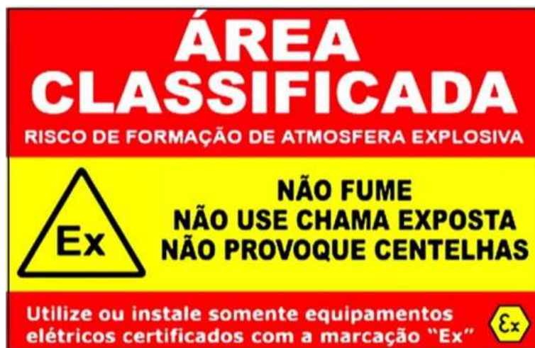
Figura 4 - Leiaute de Placa Tipo II

Modelo 02: Placa de sinalização de área classificada fixada em poste metálico a 5m da edificação no início da área controlada, fotoluminescente, retangular, 35 x 50 cm, em chapa metálica.